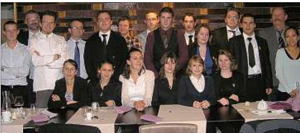
Tous les élèves sommelières sont repartis avec de bonnes connaissances de l'appellation Cairanne

Le Syndicat des vignerons de Cairanne a accueilli pour la troisième année consécutive les élèves sommelières (mention complémentaire) et leurs professeurs, du lycée des métiers de l'hôtellerie, de la restaura-